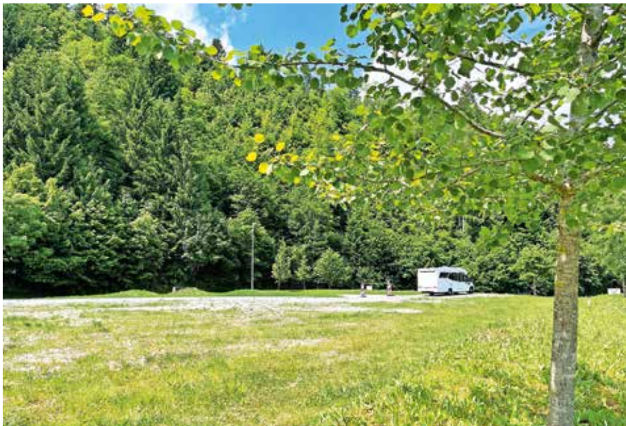
V Športno-rekreacijskem centru Pustotnik so uredili štiri postajališča za avtodome.

Pri projektu (NAD) gradimo ponudbo Škofjeloškega se je sicer pod okriljem Razvojne agencije Sora (RAS) povezalo pet partnerjev – Lokalna akcijska skupina loškega pogorja in vse štiri občine na Škofjeloškem. Skozi štiri manjše naložbe so nadgradili ponudbo na škofjeloškem območju tako za lokalne prebivalce kot turiste, je pojasnil direktor RAS Gašper Kleč. V Žireh so v sklopu projekta konec aprila končali urejanje